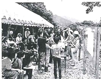
▲ジャンケン大会・コベルコ協賛