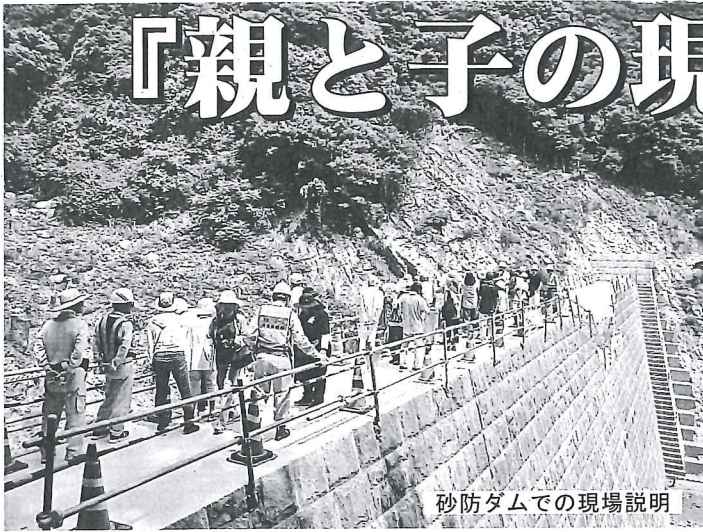
砂防ダムでの現場説明